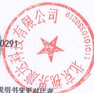
产品使用说明书变更对比表