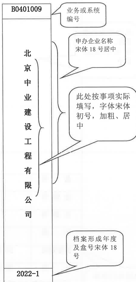
简化整理标准档案盒脊样式