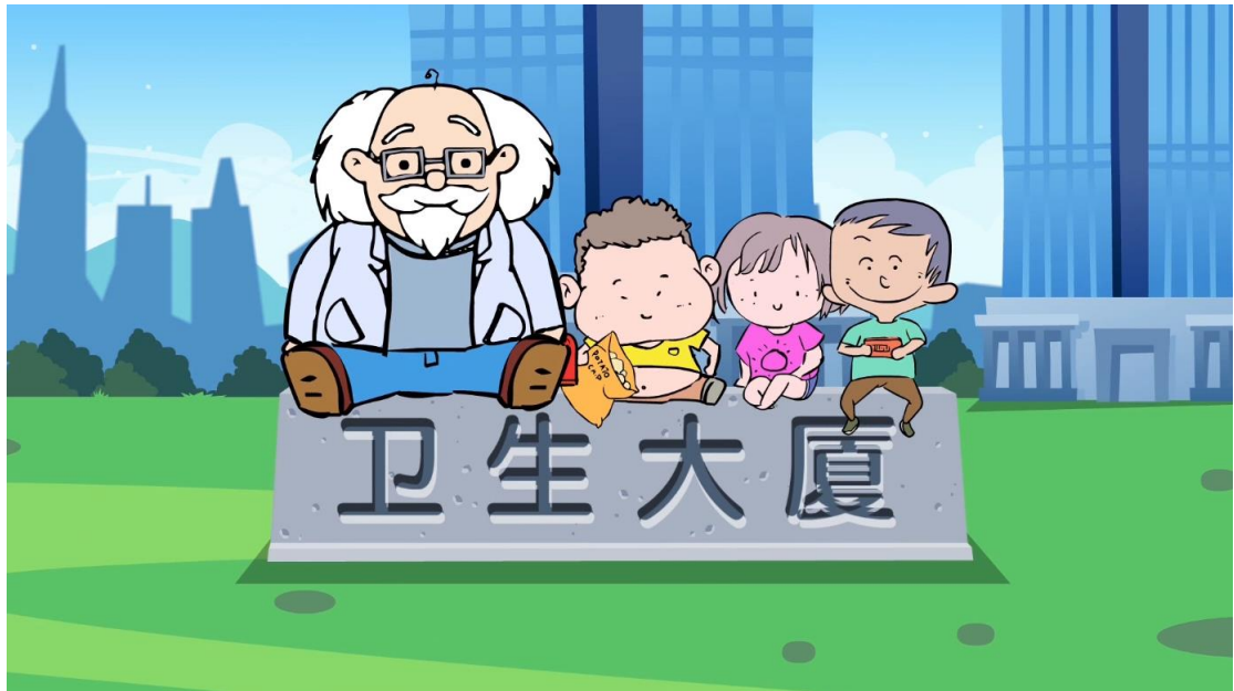
附件：2017 健康海淀栏目手绘微视频截图